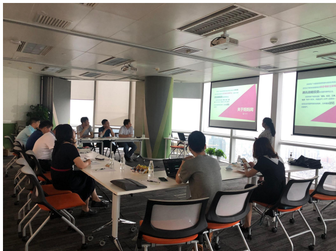
广州盛成妈妈网络科技有限公司

2020年6月，协会对妈妈网、科大讯飞、凡科等十余家代表性企业开展深入的走访调研，探讨5G、区块链、物联网、人工智能等新一代信息技术如何赋能实体经济，挖掘一批创新性强、竞争力硬、推广价值高、社会效益好的行业应用场景，为寻求转型突围的传统行业实现“互联网+”解决方案的精准对接。