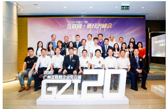
广州互联网企业20强