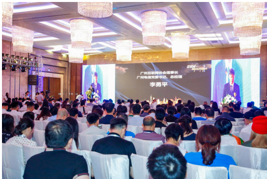
广州互联网+新经济峰会