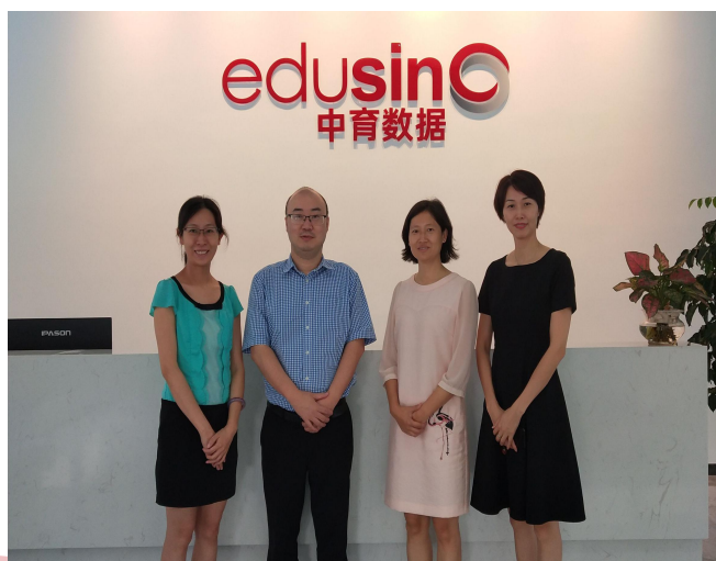
中育数据(广州)科技有限公司