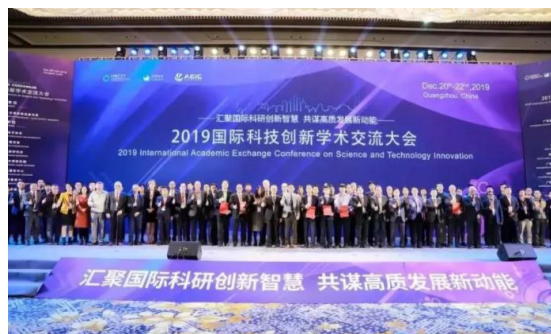
国际科技创新学术交流会