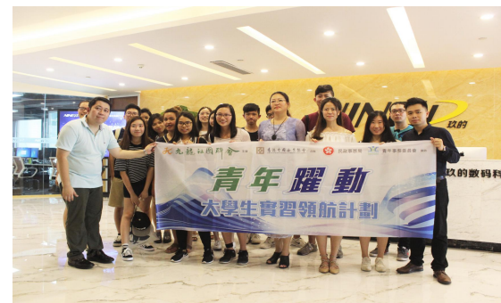
粤港澳青年人才交流