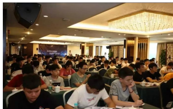
大学生互联网技术学习大会