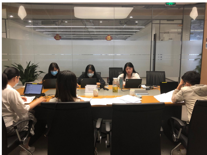
中国信息通信研究院广州分院