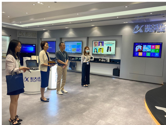
科大讯飞华南有限公司