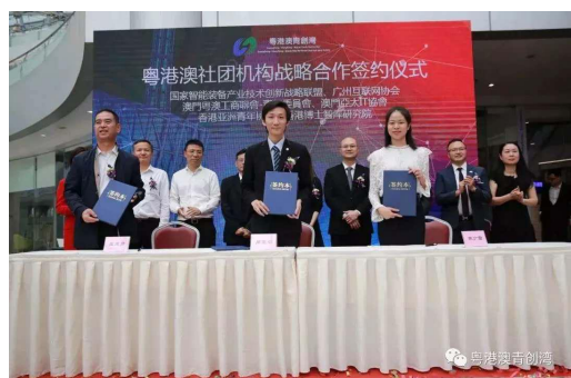
粤港澳科技合作交流