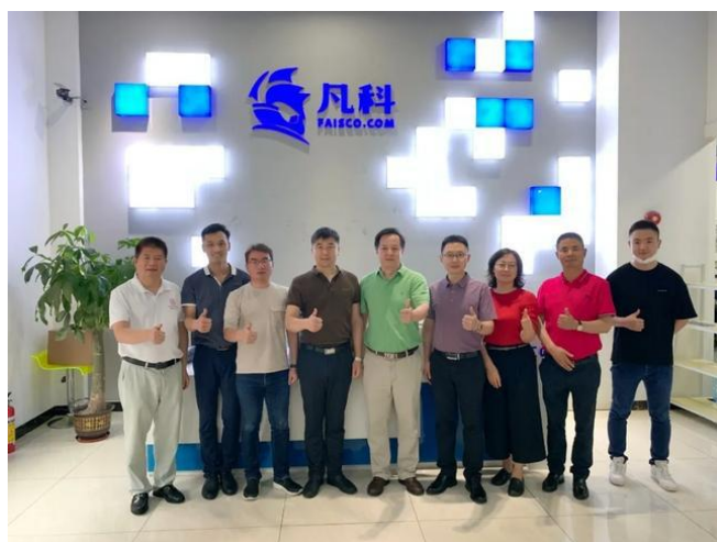
广州凡科互联网科技股份有限公司