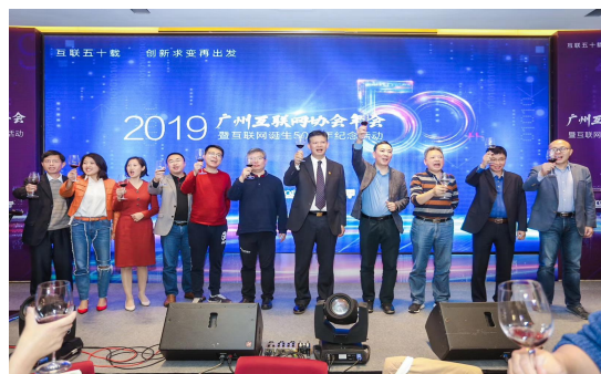
广州互联网协会年会