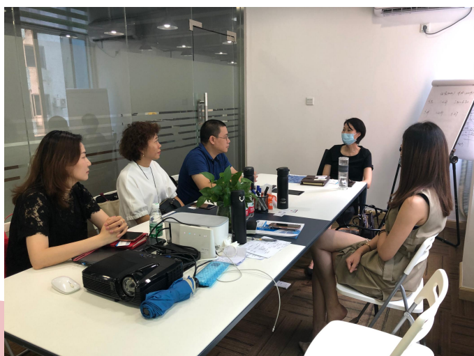
广州闰业信息技术有限公司